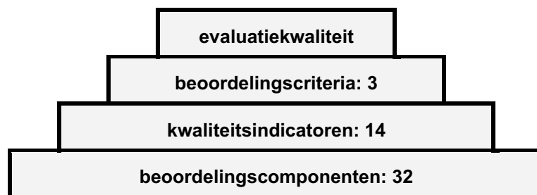
Figuur 4–1 Beoordelingspiramide

De treden van deze piramide verbeelden de verschillende beoordelingsniveaus, waarbij van boven naar beneden elke laag is te beschouwen als een verdere operationalisering van de eraan voorafgaande. De complete Beoordelingslijst met beknopte toelichting op elk van de componenten is opgenomen in bijlage 3. Zo zijn de drie RPE-kwaliteitscriteria Validiteit, Betrouwbaarheid en Bruikbaarheid geoperationaliseerd door middel van respectievelijk zes, vijf en drie indicatoren . Op hun beurt zijn deze nader geconcretiseerd in 32 componenten. De bedoeling van deze steeds verdergaande detaillering was om de te hanteren indicaties voor evaluatiekwaliteit steeds SMART-er 14 te krijgen. Dat wil dus zeggen: steeds concreter en