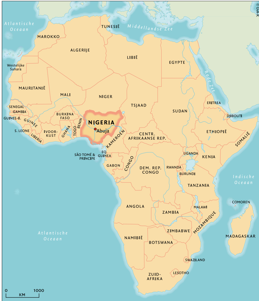
Kaart 1 Afrika - Nigeria