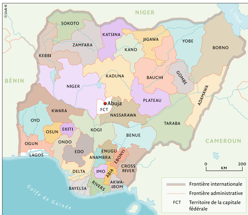
Carte 2 Les 36 états de la République fédérale du Nigéria